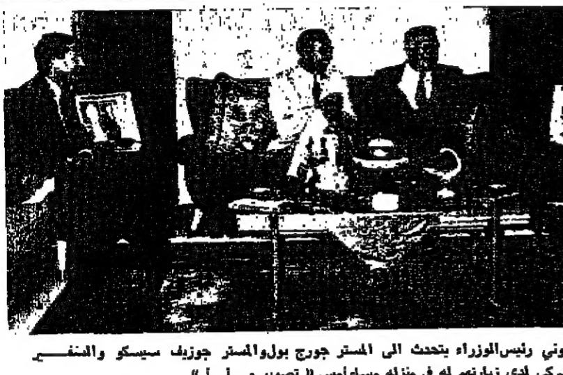
دولة السيد بهجت القفوني رئيس الوزراء يتحدث إلى المستر جورج بول والمستر جوزيف سيكو والسفير الأمريكي لدى زيارته له في منزله مساء أمس

الزيعاد في ٢١ ربيع الثاني سنة ١٣٨٨ هـ الموافق ١٧ تموز سنة ١٩٦٨ رقم ٤٥٧ AD - DUSTOUR ARABIC DAILY NEWSPAPER AMMAN WEDNESDAY 17/7/1968 No : 457